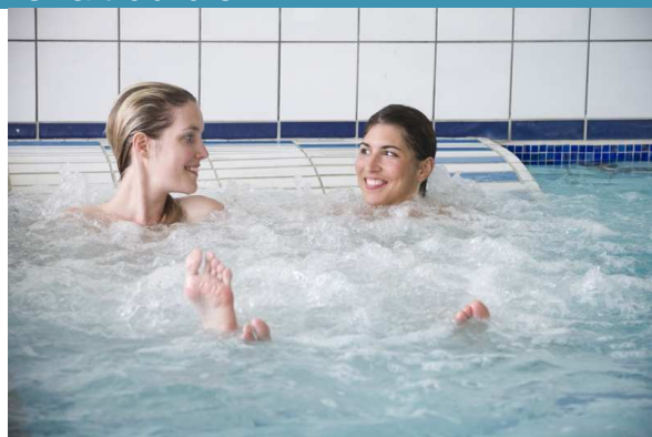
Cocooning chocolaté et lit à micro-bulles