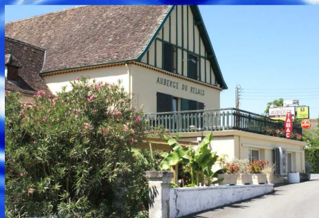
Auberge du relais 2* Nuit avec petits déjeuners à partir de 38 €/pers