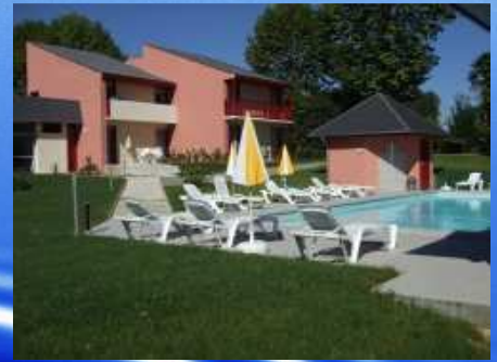
Les pavillons du Rooy Résidence de tourisme 3* Nuit à partir de 42,50 €/pers