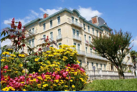
Hôtel du parc 3* Nuit avec petits déjeuners à partir de 54,50 €/pers

Faites durer le plaisir plus longtemps ... Offrez(-vous) une nuit sur place.