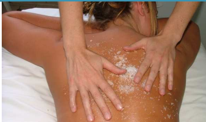
Sel extrait de l'eau minérale naturelle riche en oligo-éléments.