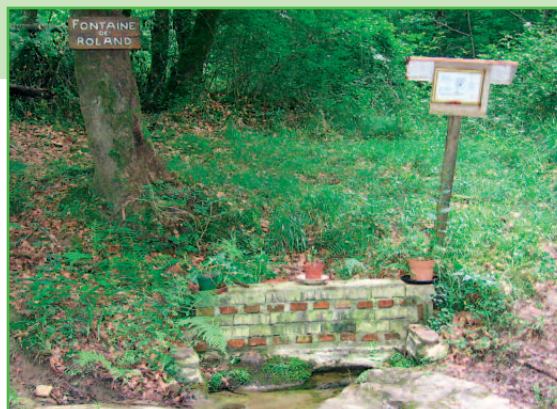
La fontaine de Roland de Roncevaux.

La légende raconte que Roland de Roncevaux fendit le roc avec son épée en une large brèche. Genou à terre il grava la croix de Dieu sur le sol pierreux. C'est lorsqu'il eut fini qu'une source jaillit, apaisant sa soif et celle de son cheval blanc.