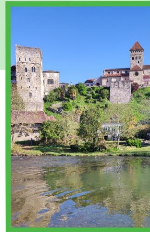
Vue depuis l'île de la Glère

A ne pas rater lors de votre visite à Sauveterre de Béarn, la tour Monréal et son aménagement muséographique qui ravira petits et grands. En son sein, le visiteur pourra découvrir la reconstitution de la cité médiévale du 13ème au 16ème siècle.