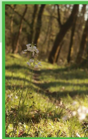
Cardamine en bordure de sentier