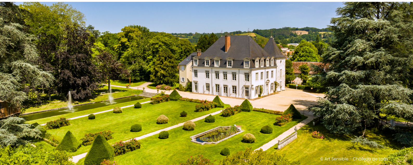
© Art Sensible - Château de Laàs